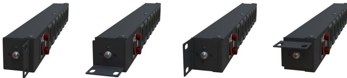
SUPORTE DE FIXAÇÃO DA CALHA DE TOMADAS EM DIVERSAS POSIÇÕES